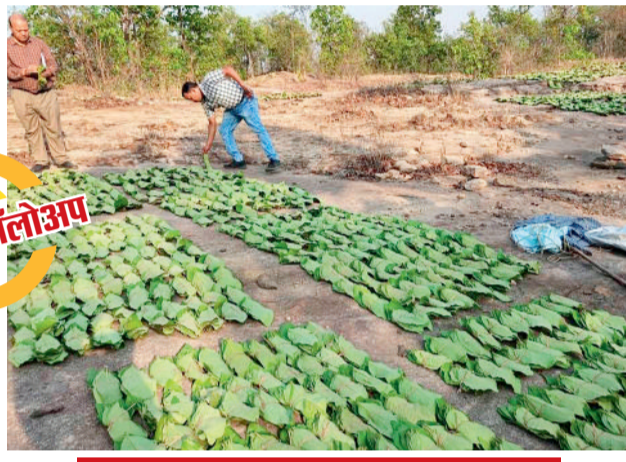
हर घर से वसूली, सबके रेट फिक्स

राजेश दास ►► जगदलपुर एक अनुमान के मुताबिक 2024 से पहले तक नक्सलियों की सेंट्रल मिलिट्री कमीशन के निर्देश पर हर साल 12 करोड़ से अधिक लेवी वसूली व अंदरूनी इलाकों से अधोषिक्त वसूली की जाती थी। नोटबंदी के बाद वसूली की राशि को ऊपर तक पहुंचाने में हो रही दिक्कत को देखते हुए नक्सली कैश को सोने में तब्दील कर रहे थे। दो दिन पहले करोड़ों रुपए नगद और एक किलो सोने के बिस्किट मिलने के बाद खुलासा हुआ है कि नक्सली अब भी जंगल में करोड़ों रुपए डंप किए हैं, जिसे जल्द ही समर्पित नक्सलियों से पूछताछ के बाद बरामद किया जा सकता है।